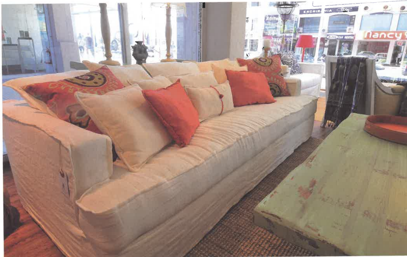
Mullido, y con muchos almohadones y grandes dimensiones, es otra de las tendencias que incorporan los sofás para esta temporada. El estilo simple de estos asientos se complementa con accesorios como mesas, espejos y luminarias de corte más orientado.