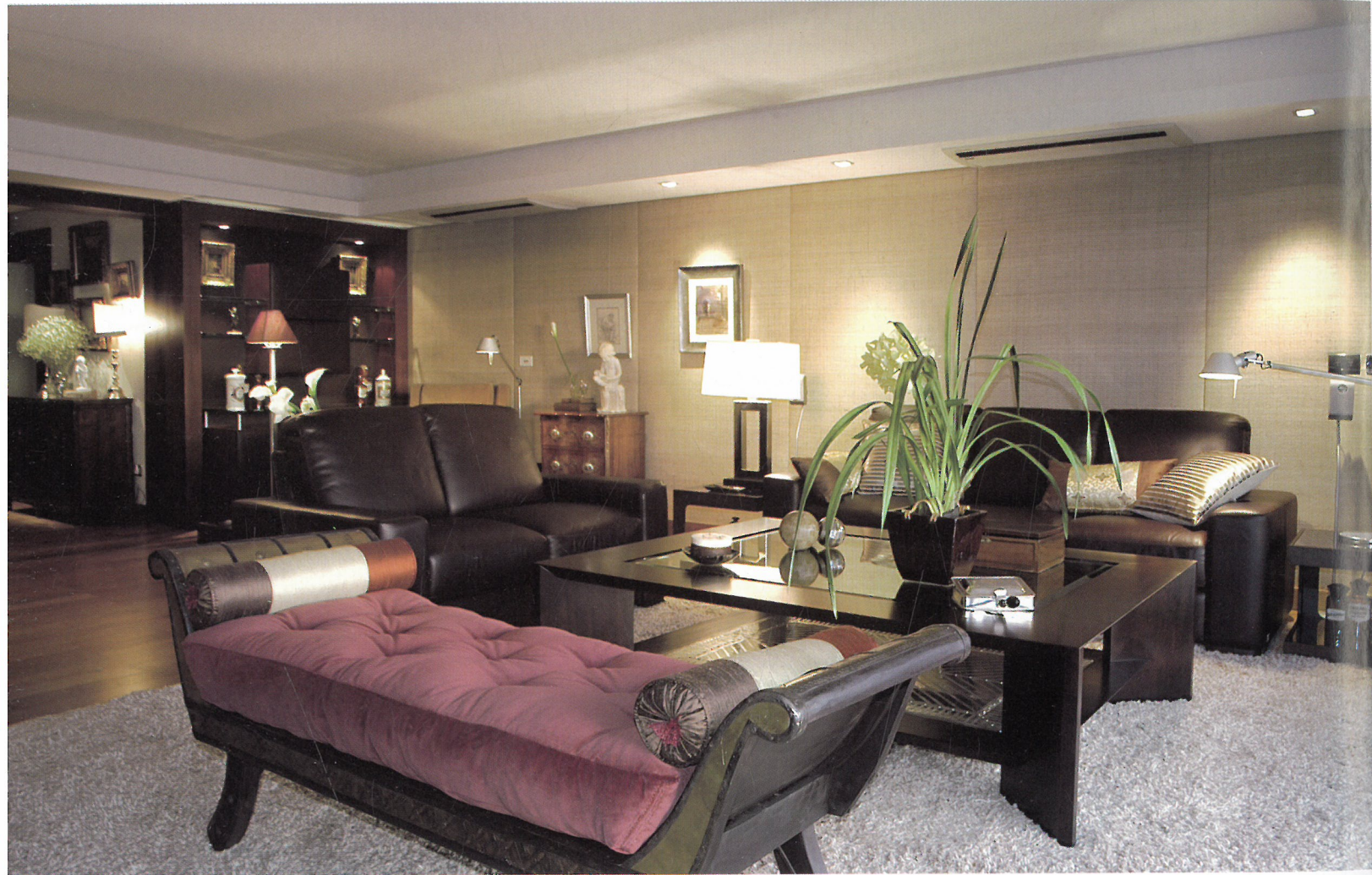
EL HALL PRINCIPAL MEZCLA TIEMPOS Y LUGARES: UN MUEBLE DE LEJANO ORIENTE, UN PAR DE LÁMPARAS DEL IMPERIO AUSTROHÚNGARO, PINTURAS DE ESCUELA HOLANDESA Y UNA PORCELANA FRANCESA DEL SIGLO XIX.

L a generosa planta de este apartamento cuenta con una formidable distribución y una proyección visual hacia el paisaje circundante que proporciona el barrio de Punta Carretas. El edificio es una reciente obra del estudio Atijas Weiss Arquitectos. Por lo tanto, todas las intervenciones de la diseñadora