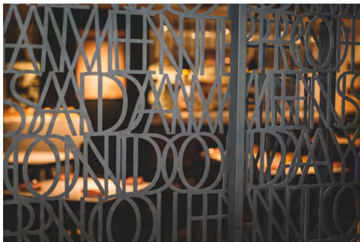
doble ALTURA · 72

De esta manera, Hyatt cubrió un nicho específico en la valoración del diseño a través de la hotelería, y la interpretación por parte de los profesionales que lo concibieron habla de un esquema que se aleja de las reglas tradicionales en cuanto a la vivencia de los espacios. “El diseño arquitectónico y el interiorismo se desarrollaron con el fin de presentar una propuesta hotelera actual, enfocada en generar un hotel con diseño, calidez, calidad y adaptado a lo que busca el visitante hoy en día. La Marca Hyatt Centric tiene su foco en la experiencia de sus visitantes como clave del éxito de la marca, lo que logra a través de una propuesta que pone en valor las claves del destino donde se instala y un excelente servicio. En nuestro caso, inmerso en medio de Montevideo, propone un interiorismo que busca destacar el arte nacional a lo largo de todo el hotel, acompañado de texturas y terminaciones que hacen alusión a lo que interpretamos como propio, local, que representa nuestra historia”, concluye Raij.