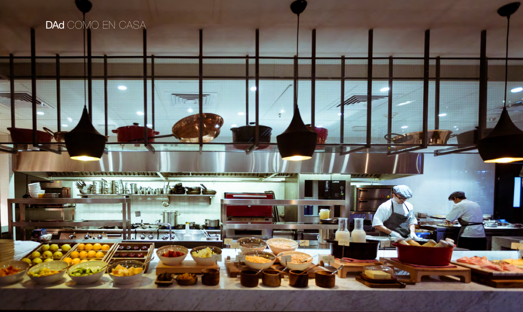
Cocina abierta del Restaurante Plantado.

De esta manera, Hyatt cubrió un nicho específico en la valoración del diseño a través de la hotelería, y la interpretación por parte de los profesionales que lo concibieron habla de un esquema que se aleja de las reglas tradicionales en cuanto a la vivencia de los espacios. “El diseño arquitectónico y el interiorismo se desarrollaron con el fin de presentar una propuesta hotelera actual, enfocada en generar un hotel con diseño, calidez, calidad y adaptado a lo que busca el visitante hoy en día. La Marca Hyatt Centric tiene su foco en la experiencia de sus visitantes como clave del éxito de la marca, lo que logra a través de una propuesta que pone en valor las claves del destino donde se instala y un excelente servicio. En nuestro caso, inmerso en medio de Montevideo, propone un interiorismo que busca destacar el arte nacional a lo largo de todo el hotel, acompañado de texturas y terminaciones que hacen alusión a lo que interpretamos como propio, local, que representa nuestra historia”, concluye Raij.