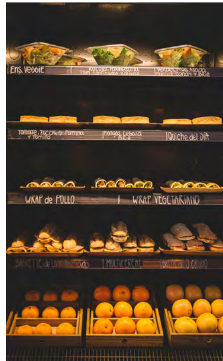
Tres diferentes vistas del Deli Café.