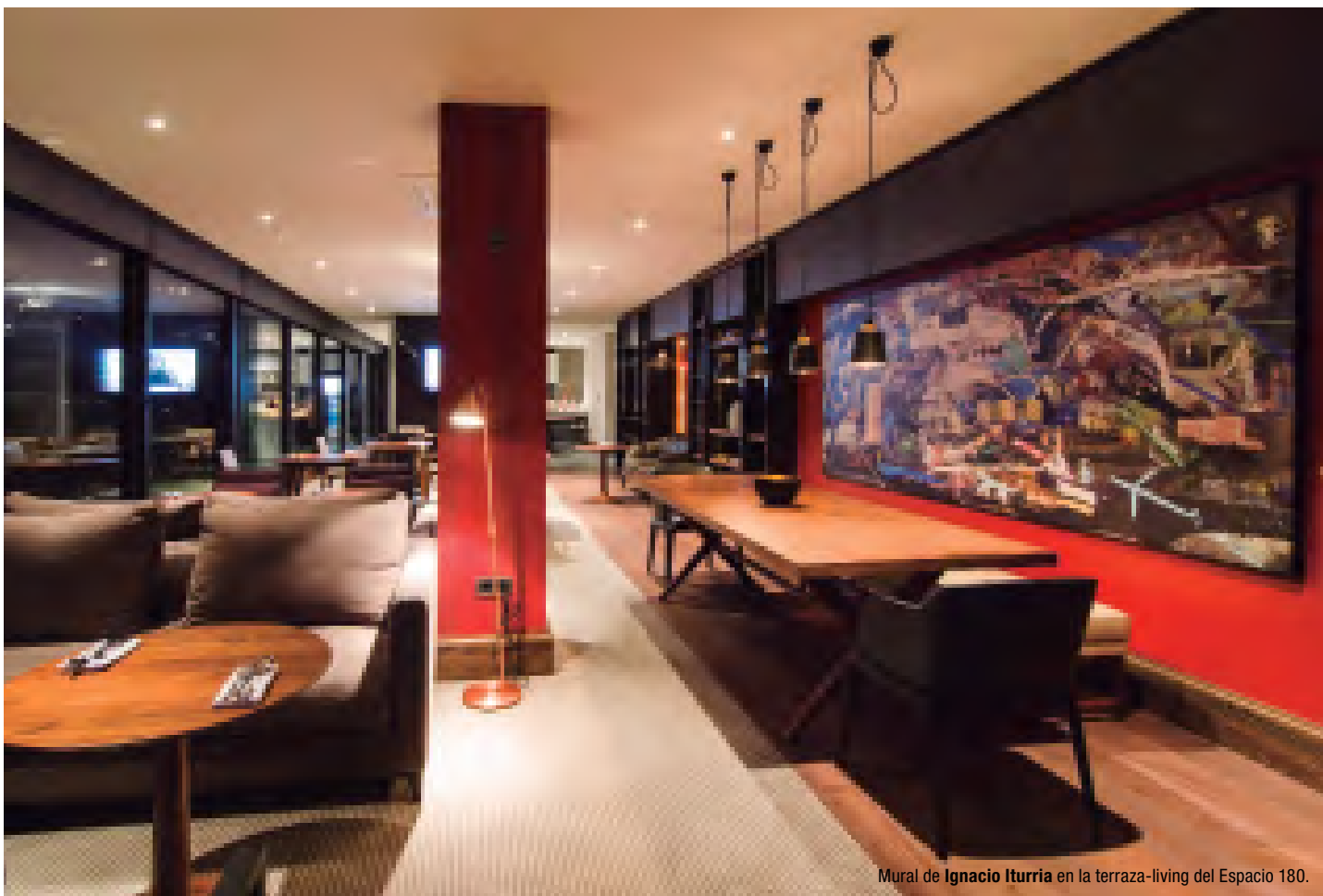
Mural de Ignacio Iturría en la terraza-living del Espacio 180.

La diseñadora explicó que “para recrear un ambiente a escala residencial fue necesario evitar la imponente percepción de una gran nave donde el ojo puede abarcar el todo desde el acceso”. En ese sentido, priorizó el concepto de vivencia en el recorrido, el descubrimiento gradual de los diferentes lugares, alentando la sensación de transitar una experiencia.