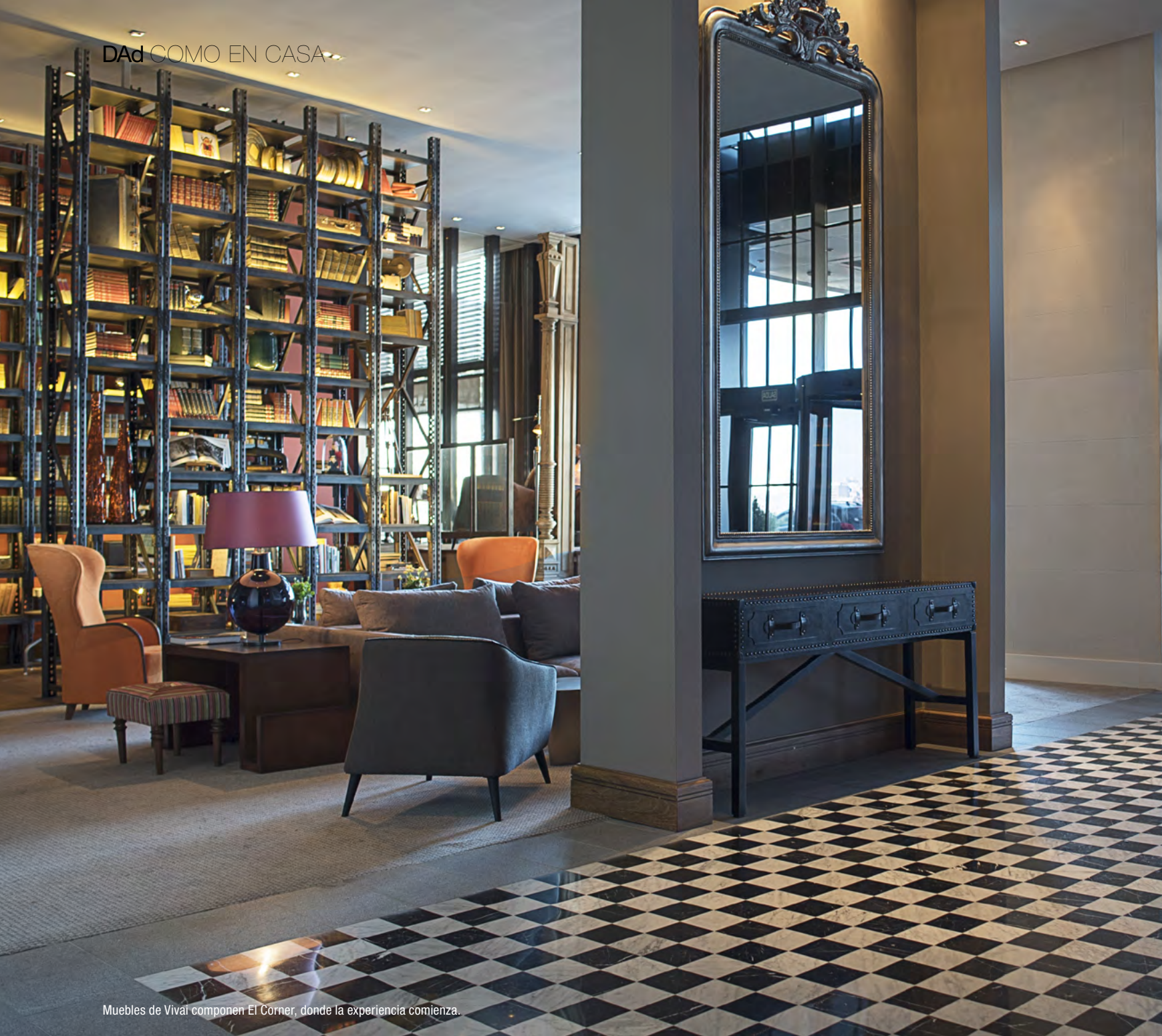
Muebles de Vivaí componen El Corner, donde la experiencia comienza.

En la planta baja, Deli se presenta como una cafetería donde la sola presentación de los productos artesanales de la panadería, reinventan el estilo almacén y aducen a una muy cuidada elaboración, disponible no sólo para los huéspedes del hotel, sino con acceso independiente desde la rambla. Contiguo al mismo, en Moderno Bar , se refleja una estética metropolitana, desde el revestimiento en azul intenso, cierto aire art déco de los murales, hasta las exclusivas piezas de cristalería.