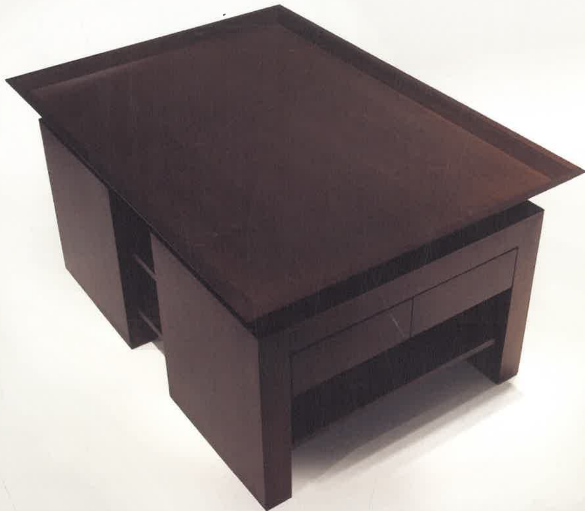
"Escondo Grande" Design: Liliana Di Lorenzo Mahogany wood 1.10 meter x 0.80 meter x 0.50 meter