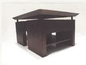
"Escondo Grande" Diseño: Liliana Di Lorenzo Madera: Caoba 1.10 m x 0.80 m x 0.50 m